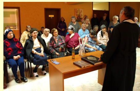
Bătrâni asistând la slujba în cinstea Sfântului Nectarie, 09 noiembrie 2009

Moaștele Sfântului Nectarie se află și în România, la Mănăstirea Radu-Vodă, din București.