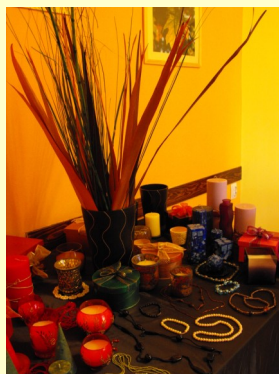
Obiecte artistice realizate de beneficiarii proiectului “Dreptul la șanse egale”

concretizat în organizarea a 7 expoziții și participarea la alte 3. De asemenea, am organizat 4 spectacole artistice cu protagoniști din cadrul acestui proiect. Printre rezultatele proiectului mai enumerăm: creșterea nivelului de trai și a implicării sociale, îmbunătățirea comunicării, creșterea încrederii în forțele proprii.